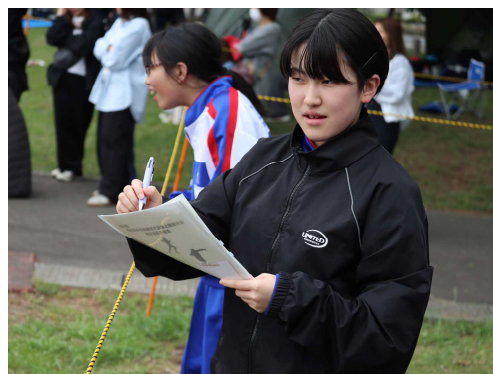
↑選手の活躍を見守る生徒。この思いが、みんなの力になったことでしょう。