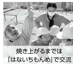
焼き上がるまでは「はいちもんめ」で交流