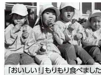
「おいしい!」もりもり食べました

11月17日、葛尾幼稚園でおいもパーティーを行いました。園児と小学校1・2年生が栽培し、掘ったさつまいもを新聞紙でくるんでぬらし、アルミホイルに包み、地域の方に炭で焼いてもらいました。