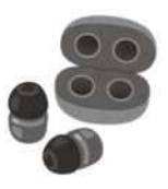
ワイヤレスイヤホン