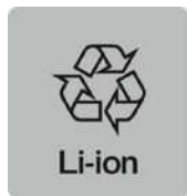
リチウムイオン電池