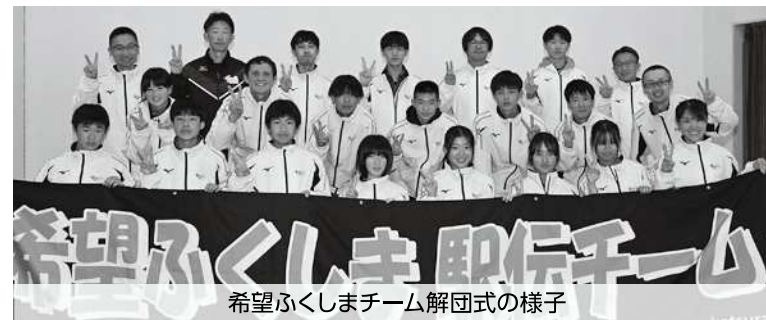
希望ふくしまチーム解団式の様子

第37回ふくしま駅伝が11月16日、白河市のカタルススポーツパーク陸上競技場をスタートし、福島市の県庁前までの16区間、96.3キロ、51チームが出場して繰り広げられました。