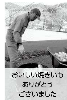
おいしい焼きいも ありがとう ございました

完成した焼きいもをほおばる子どもたちから「おいしい!」と笑顔があふれていました。