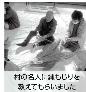
村の名人に縄もじりを 教えてもらいました