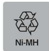
ニッケル水素電池