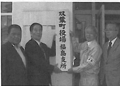
双葉町役場福島支所設置の様子

3月11日以前の双葉町、双葉地方を取り戻すため職員一丸となって頑張っていきます。