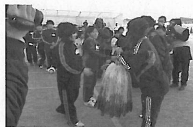
元マリーゼ選手とサッカーを楽しむこどもたち