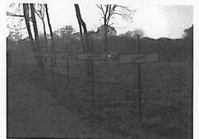
＜避難により消滅した自治体名の「ラド」＞

ウクライナ・チェルノブイリ原発では、4号機の事故の原因とその対応、さらに石棺の様子と今後の老朽化対策について説明を受けた。事故が起きた4号機は劣化が進み、シェルターで覆う作業計画が進んでいるが、燃料の取り出しについては未だ計画が示されていない。放射能という時空を超えるものに対してもう少し謙虚であるべき、人間のおごりが事故の最大の原因だと感じた。チェルノブイリ市内の記念公園には、避難して消滅