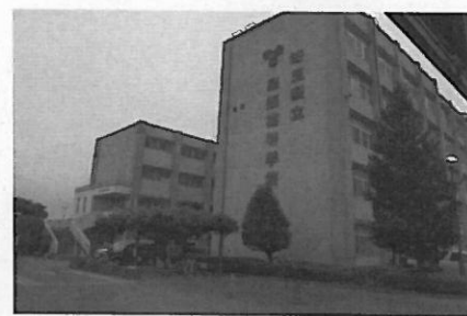
双葉町役場埼玉支所のある旧埼玉県立騎西高校